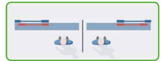
Single Action Wings